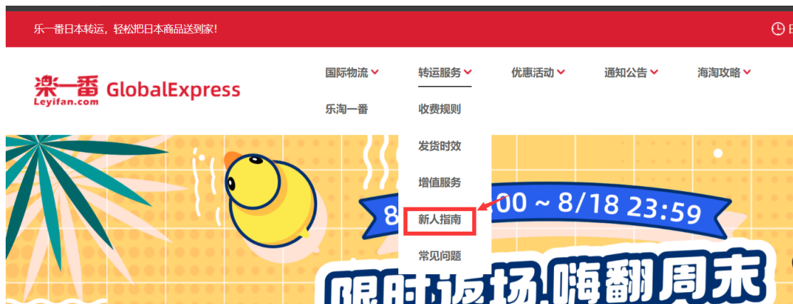
乐一番的新人指南入口

(1)、 一定一定要记住在自己的地址里加上自己的会员专属 ID! ,不然仓库根本不知道你是谁,新人指南里有标准的收件地址填写方式,不要填错了